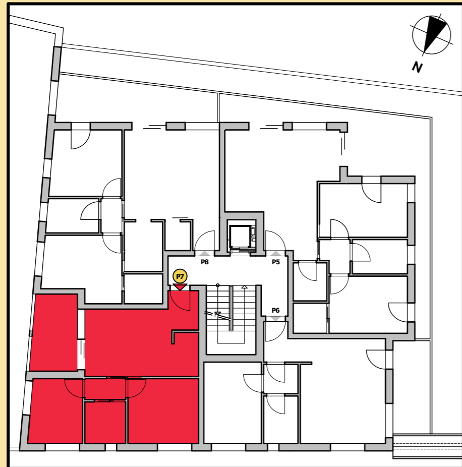
Lageplan 1. Obergeschoss