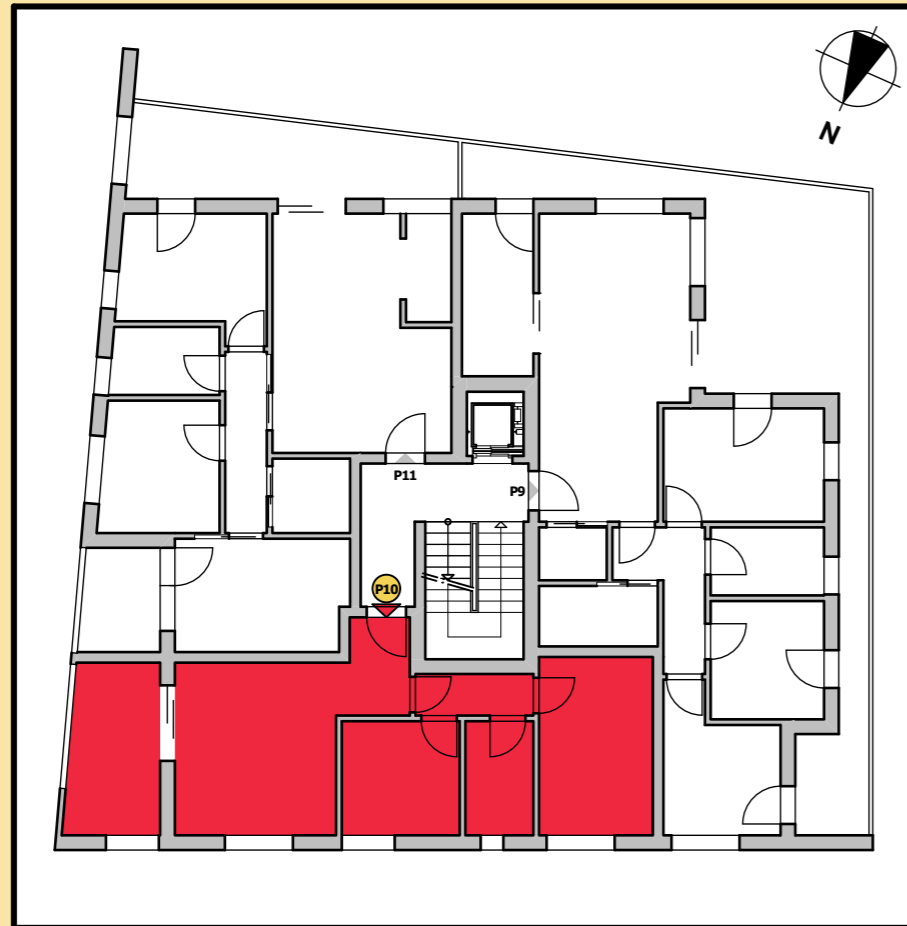
Lageplan 2. Obergeschoss