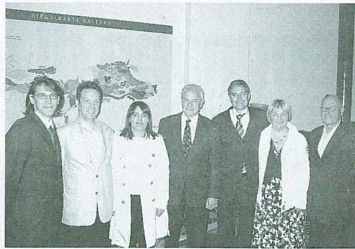
A sinistra: la simulazione. Sopra: l'incontro dei vertici locali dell'Svp

Hermann Knoflacher, esperto di viabilità, il trenino dovrebbe partire da Bolzano, probabilmente dalla funivia del Renon, attraversare viale Druso e poi dirigersi verso l'Oltradige. «Il progetto è sicuramente un valido investimento per il futuro - ha affermato lo stesso Knoflacher - se si pensa al continuo aumento del costo della benzina e alla